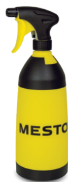
FLIP Type 3113R