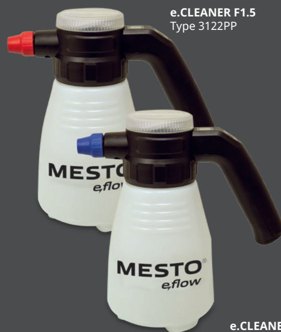
e.CLEANER F1.5 Type 3122PP