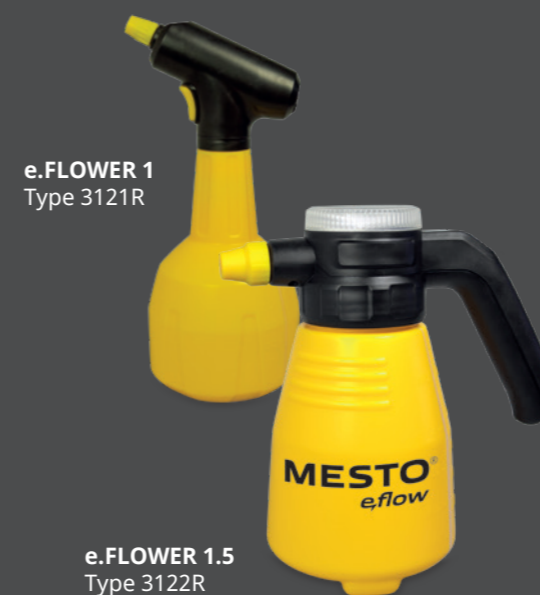
e.FLOWER 1 Type 3121R