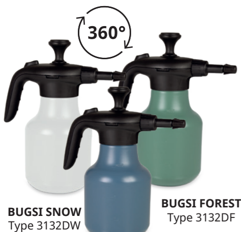
BUGSI SNOW Type 3132DW