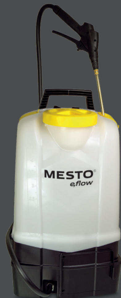
e.RS185 Type 3626