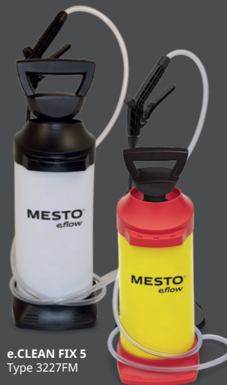
e.CLEAN FIX 5 Type 3227FM