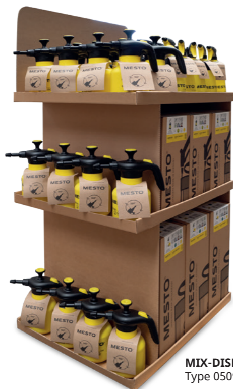
MIX-DISPLAY Type 0509