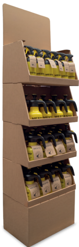
PRÉSENTOIR EMPILABLE Type 0508

Deux écrans attractifs à configurer soi-même