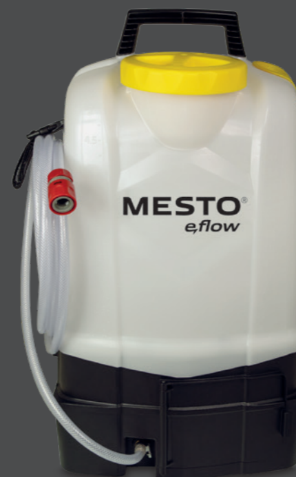
e.AQUA 20 Type 3628W