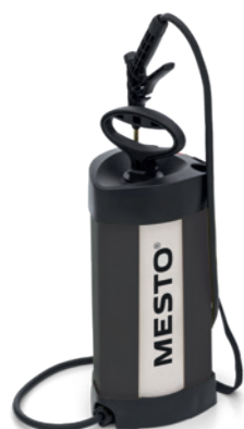
PICO BLACK EDITION Type 3232BP