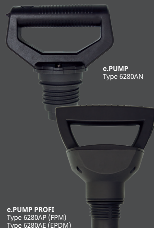
e.PUMP Type 6280AN