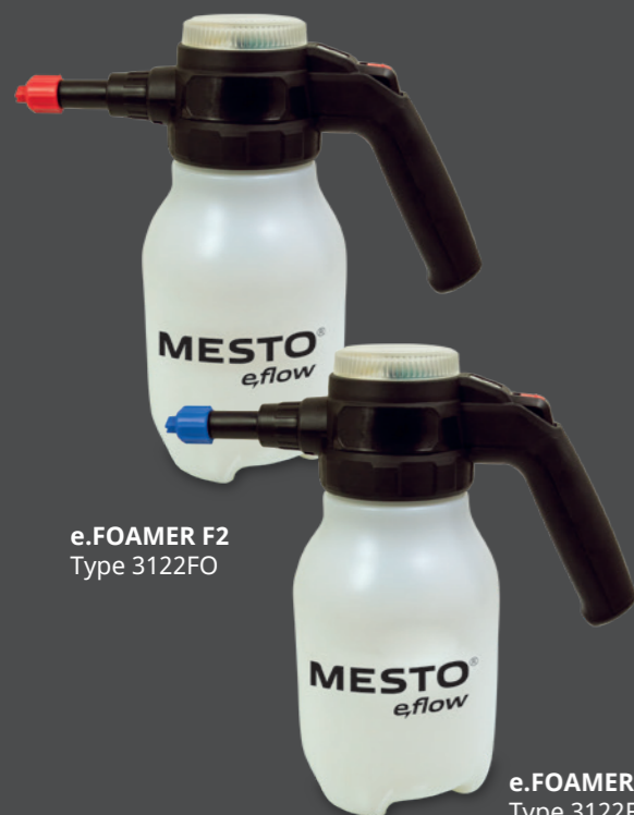
e.FOAMER F2 Type 3122FO