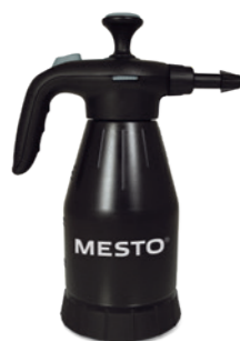
CLEANER SUPER EXTREME 1.5 Type 3132SE

Cleaner Super Extreme et édition PICO Black