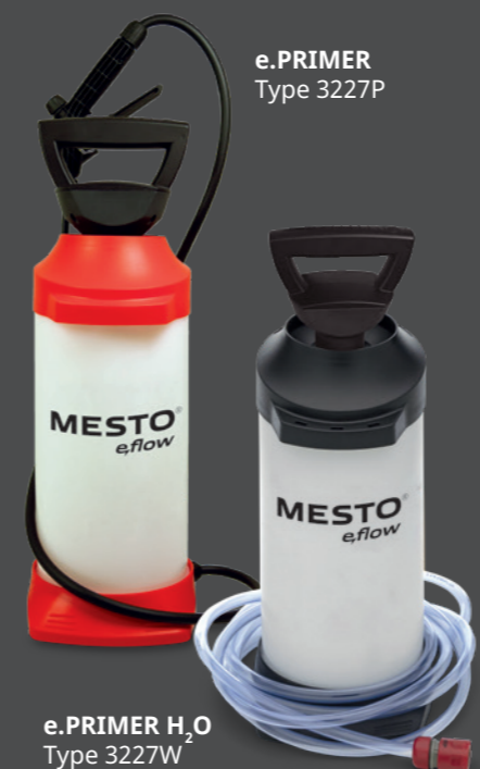
e.PRIMER Type 3227P